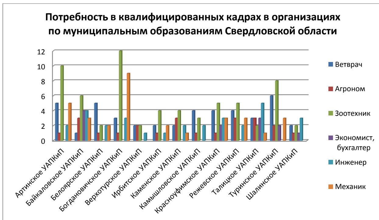
Рис. 1. Потребности в квалифицированных кадрах в организациях по муниципальным образованиям Свердловской области

Наименьшую потребность в кадрах испытывают организации в сфере экономики. Специалисты, обладающие знаниями в области зоотехнии, ветеринарии, агрономии, а также инженеры и механики требуются во всех муниципальных образованиях Свердловской области,